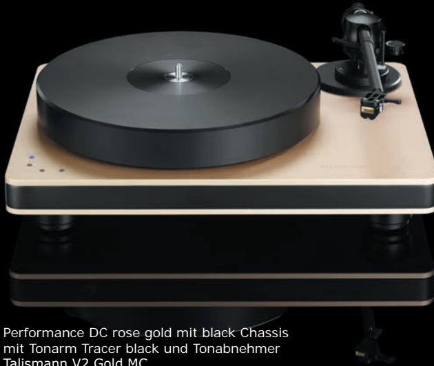
Performance DC rose gold mit black Chassis mit Tonarm Tracer black und Tonabnehmer Talismann V2 Gold MC

Maximale Stabilität bei optimaler Agilität garantiert das Tonarmrohr aus extrem verwindungsstifem Karbon. Perfekt zugänglich liegt das magnetische Antiskating in der Drehachse. Das Headshell aus Aluminium mit einstellbarem Azimuth und das Tonarmgegengewicht können ebenso leicht wie präzise justiert werden. Das neueste Highlight von clearaudio, ein Genuss für Auge und Ohr.