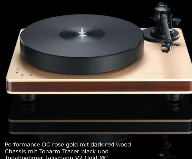
Performance DC rose gold mit dark red wood Chassis mit Tonarm Tracer black und Tonabnehmer Talismann V2 Gold MC

Performance DC rose gold with black chassis with tonearm Tracer black and cartridge Talismann V2 Gold MC